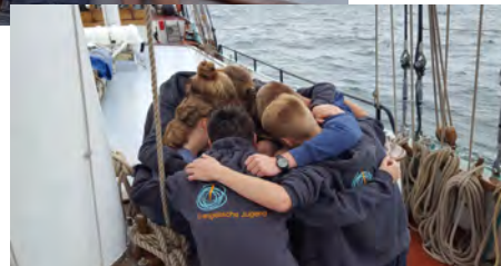
Es freuen sich die TeamerInnen,