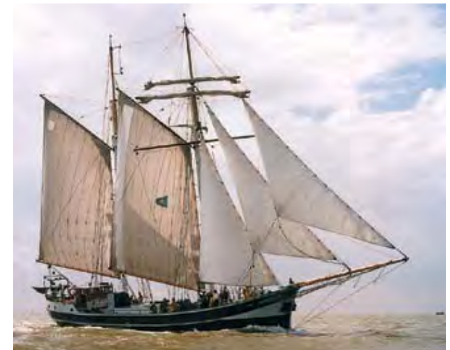
mit der „Banjaard“