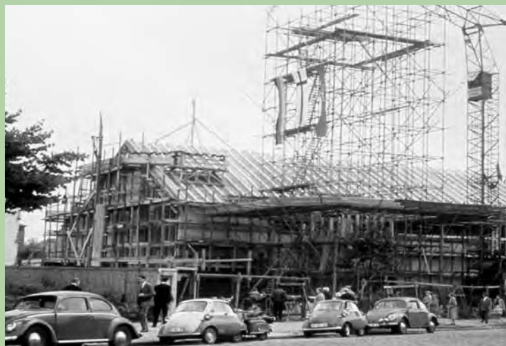
Richtfest für die Kreuzkirche im Sommer 1961

Festwoche vom 15. - 22. April 2012 Programm, siehe nächste Seite