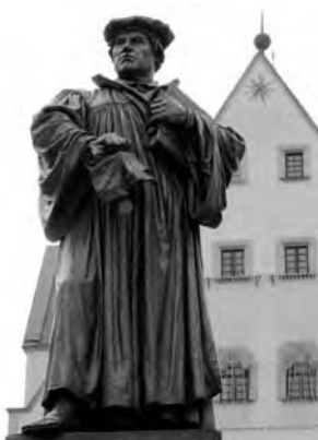
Martin Luther auf dem Marktplatz in Eisleben